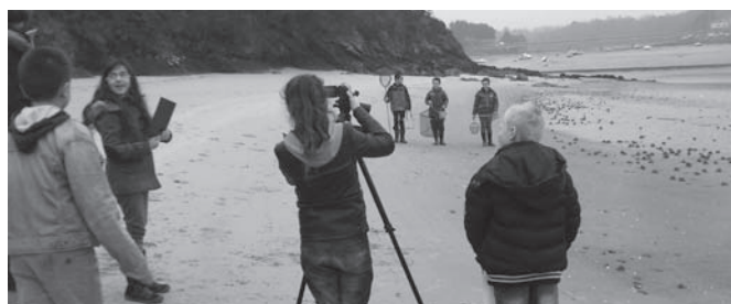
CM en plein tournage au Guildo

chargé de la caméra, d'un script, assistant le réalisateur, et d'un clapiste. Ils furent aussi tous acteurs à un moment ou à un autre. Dans les moments de pause, quand ils ne pouvaient être ni acteurs ni techniciens, les élèves purent s'adonner aux joies du Land Art sur la plage, échafaudant des châteaux de sables ou créant des tableaux de coquillages. Ces moments furent intenses. Et, nous eûmes la chance d'avoir la météo avec nous ! Merci beaucoup à tous les parents accompagnateurs ! Cependant, le travail n'est pas fini : il reste des séquences à tourner à l'école. Ensuite viendra le temps du montage du film : c'est la maîtresse qui s'en chargera, aidée par la conseillère pédagogique en informatique de la circonscription de Dinan Nord.